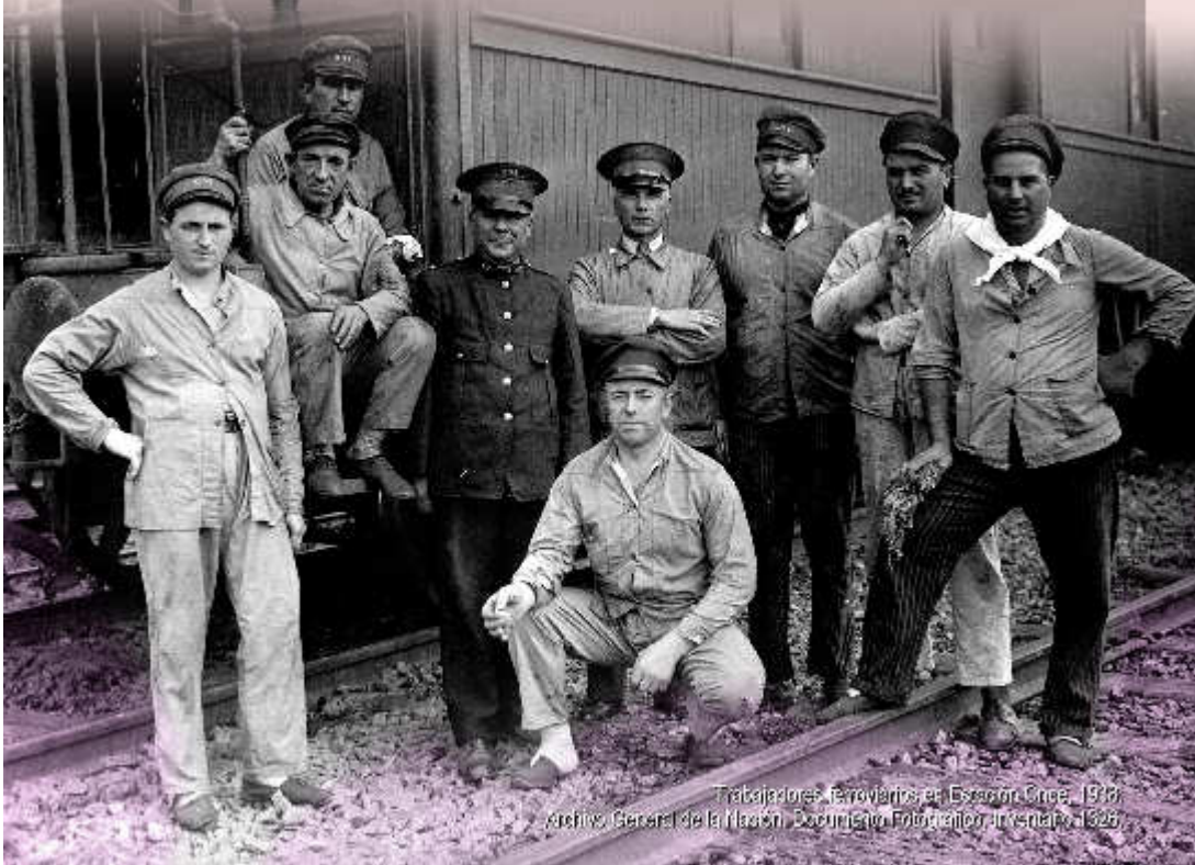
Trabajadores ferroviarios en Estación Ciroes, 1936.