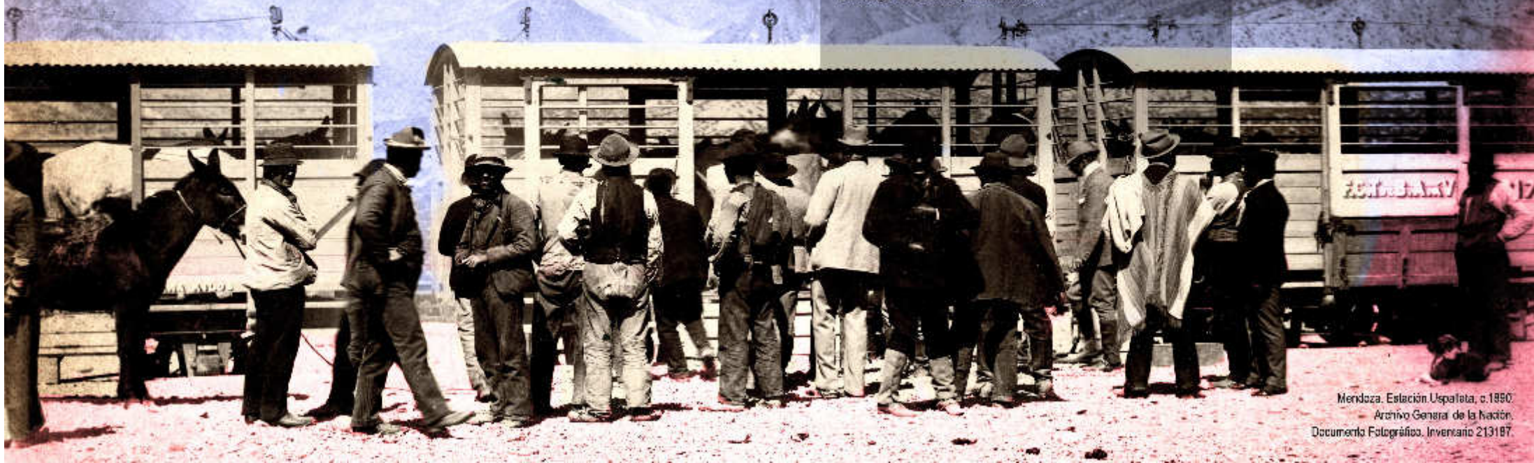
Mendoza. Estación Uspalata, c.1880. Archivo General de la Nación. Documento Fotográfico, Inventario 213187.

Logotipo de Ferrocarril Andino. Archivo General de la Nación. Documentos Escritos, Sala VII